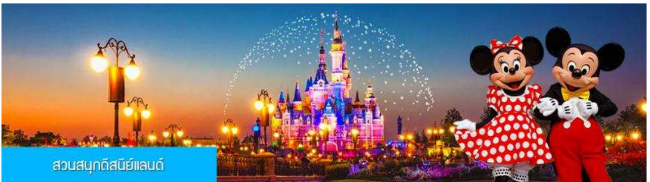
สวนสนุกดิสนีย์แลนด์

พักที่ โรงแรม Luna Garden Hotel or Holiday Inn Express Hotel 4* หรือเทียบเท่าในเมืองเซี่ยงไฮ้