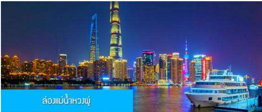
ล่องแม่น้ำหวงผู่