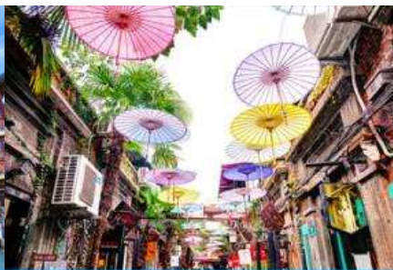
ย่านเกียบจื่อฟา