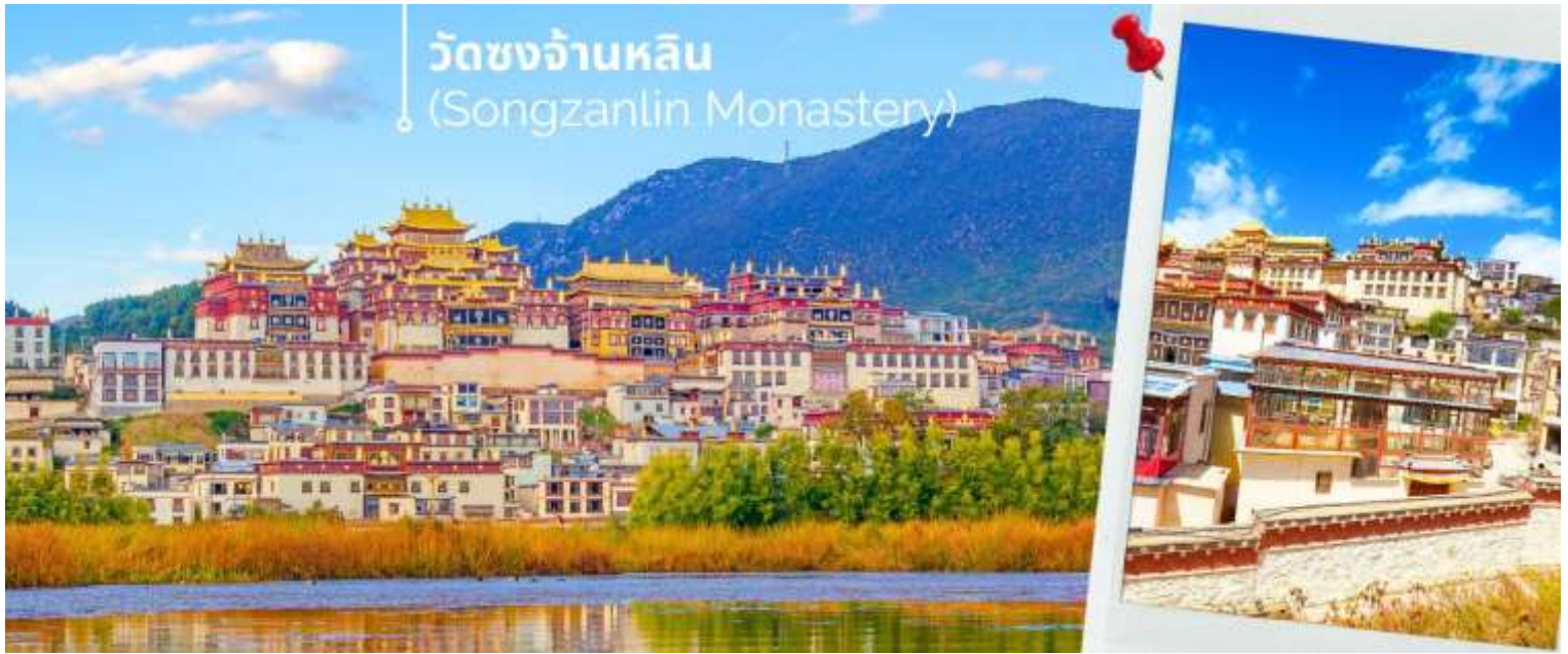
วัดซงจันหลิน (Songzanlin Monastery)