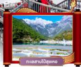
ทะเลสาบไป๋ลุยเหอ