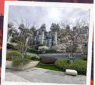
Tian An 1,000 Trees Square