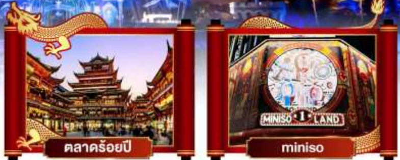
ตลาดร้อยปี