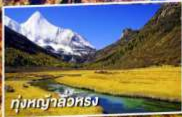
ทุ่งหญ้าลือหวง