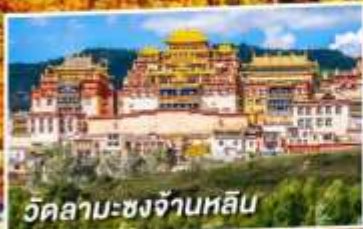
วัดลามะจงจ้านหลิม