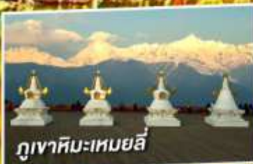
ภูเขาหิมะเหมยลี่