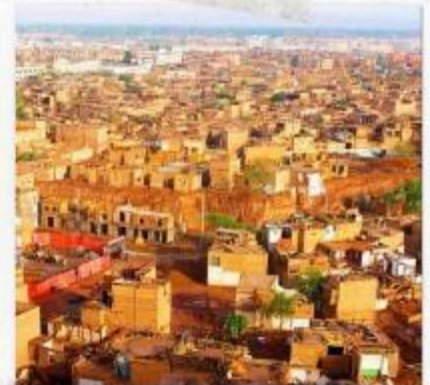
เมืองคาสือ