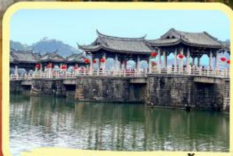
• สะพานโบราณกว้างจี