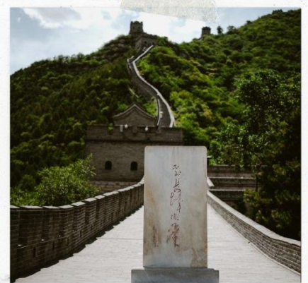
กำแพงเมืองจีน ด่านฉวิหยงกวน