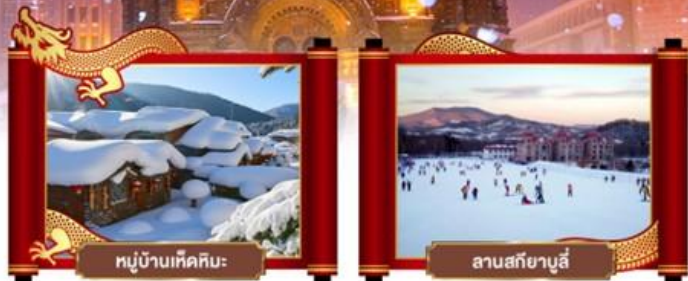
หมู่บ้านหิมะหิมะ