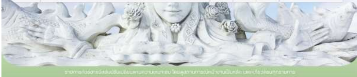
รายการทัวร์อาจมีข้อเปลี่ยนแปลงโดยไม่ต้องแจ้งก่อน โดยผู้จัดงานจะแจ้งล่วงหน้าเป็นปกติ แต่จะไม่รับผิดชอบต่อความเสียหาย