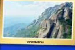
เขาผิงซาน