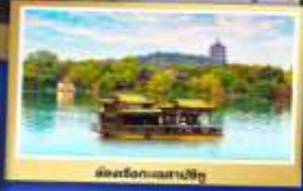
เมืองริ่งกวงเสสปิงอู