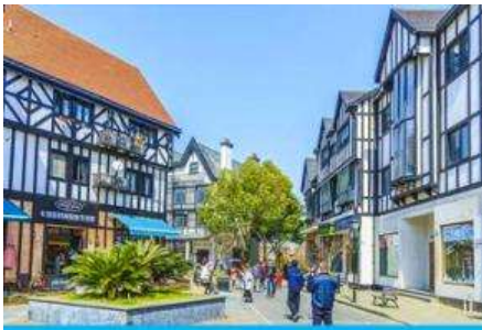
ย่าน เทมส์ทาวน์