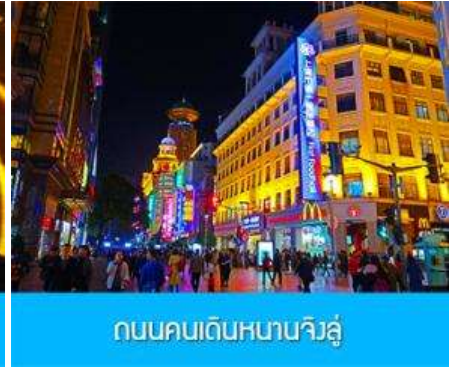
ถนนคนเดินหนานจิงลุ่