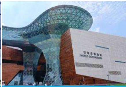
พิพิธภัณฑ์งานเอ็กซ์โป